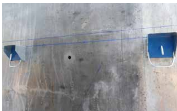
1. Réalisation du trait de niveau et mise en place de l'aimant provisoire sur la banche.