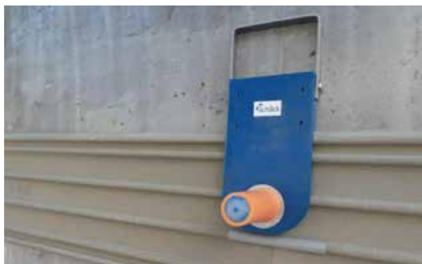
3. Retrait des aimants provisoires et mise en place des clips de jonction entre éléments.