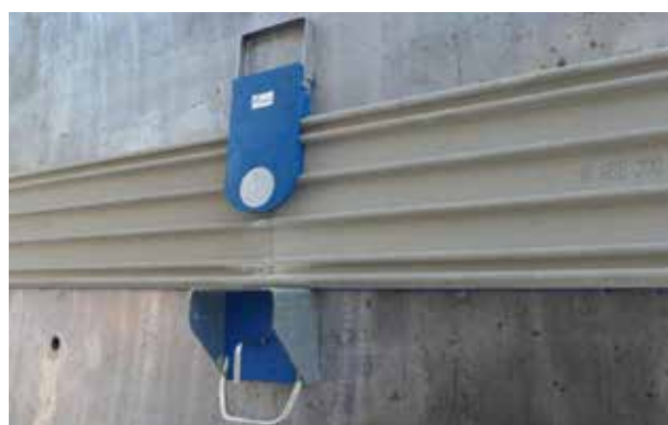
2. Mise en place de l'ASE et des aimants ASE Magnet.