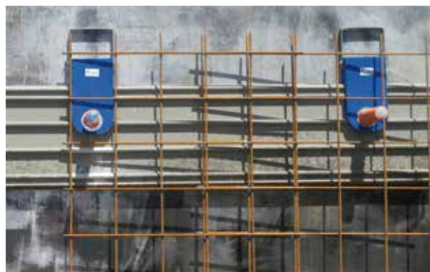
4. Mise en place du ferrailage, mannequins, gaines techniques et cône de compression.