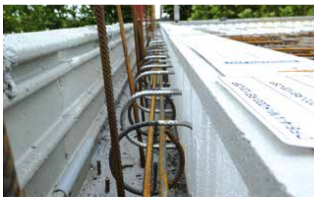
5. Aspect face intérieure avec rupteur Schöck Rutherma® type DF.