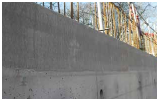
6. Aspect face extérieure.