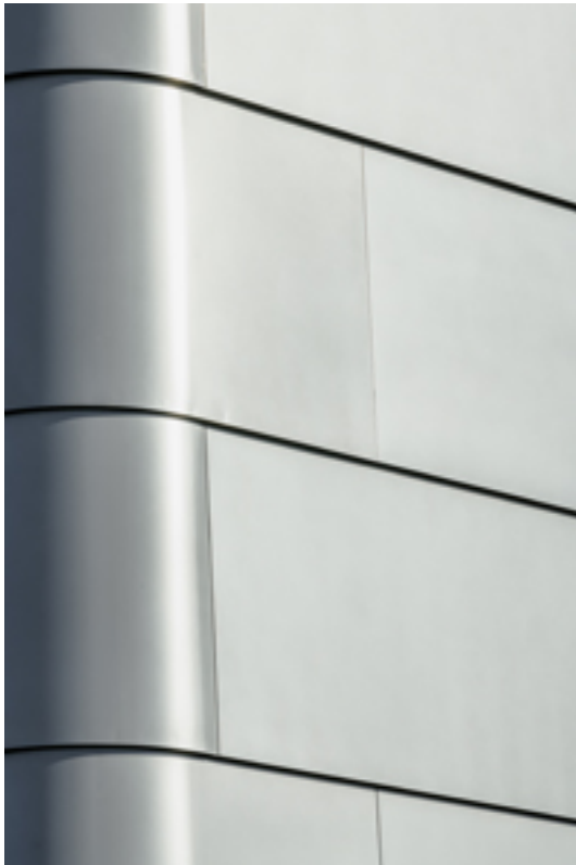
Bei der Fassade aus Aluminium legten die Architekten Wert auf eine harmonische Ausführung wie aus einem Guss.