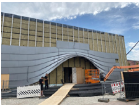
Um die schräge Verkleidung der übereinandergelegten „Schuppen“ zu erreichen, verlegten die Fassadenbauer die Elemente ähnlich wie Schindel und Mauerstein versetzt überlappend.