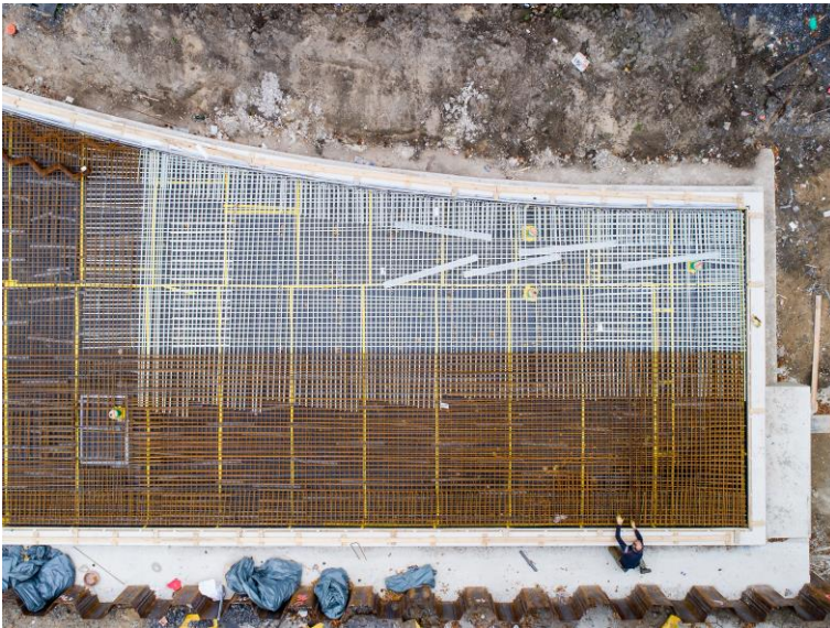
[Combar Einbau von oben.jpg]

Um die Weichensperre nicht mit elektrisch leitfähigen Materialien zu beeinflussen, wird zur Bewehrung in diesem Bereich der Glasfaserverbundwerkstoff Combar eingesetzt.