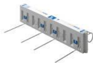
Isokorb typu Q