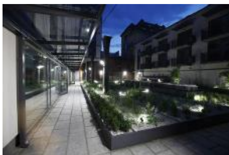
Źródło: Tribeach Holdings LLC./MOSTOSTAL WARSZAWA S.A.

Inwestycja Wawrzyńca 19 znajduje się przy kameralnej ulicy Świętego Wawrzyńca. Budynek składa się z sześciu kondygnacji oraz garażu podziemnego. Znajdziemy w nim zarówno kawalerki, jak i ponad stumetrowe apartamenty idealne dla rodzin oraz osób ceniących przestronne wnętrza. Na parterze, od strony ul. Świętego Wawrzyńca znalazło się również miejsce dla lokali usługowych, zaprojektowanych pod działalność restauracyjną, handlową, rekreacyjną oraz biurową. Inwestycja powstała z inicjatywy nowojorskiej firmy deweloperskiej Tribeach Holdings LLC., a głównym wykonawcą była firma MOSTOSTAL WARSZAWA S.A. Za projekt budynku odpowiedzialna była Agencja Projektowa TEKTON s.c. przy współpracy z OBO Architekci.